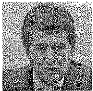
Nazionale 24/11/10 13:28